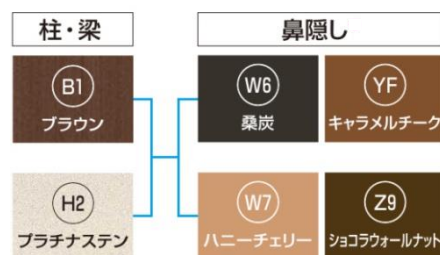
柱・梁と鼻隠し木調カラーの組み合わせ

本体カラーはアルミ 5 色、鼻隠しは木調カラー 4 色を設定。他のエクステリア商品や、窓や玄関ドアなど住宅全体でのカラーコーディネートが可能です。また、サイドパネルや、ワンランク上の車庫空間の提案が可能なスクリーンパネル、軒天パネルなどの様々な機能的オプションも設定。安心の性能に加え、魅力的な車庫空間を演出できます。