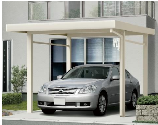
「ジーポート neo」積雪 150 cm 4 本柱仕様 施工イメージ（左）2 台用（右）1 台用

「ジーポート neo」は、柱や梁をはじめとする強固な部材形状と、実物試験による性能検証に裏打ちされた高い耐積雪性能で、愛車をしっかりと守るカーポートです。