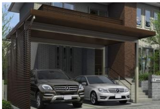
オプション例 (左)サイドパネル (右)スクリーンパネル、軒天パネル