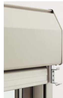
ボックス部取付金具 (シャッター点検板カバー設置前後)