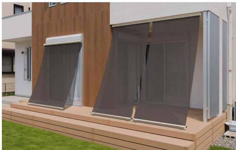
＜施工例＞ 新施工方法の枠付けシャッター納まり（左）と天井付け納まり（右）

夏場の室内に入流する熱の約70%は、開口部（窓）から入ってくるとされており、住宅の中でもっとも熱が入る場所です。熱の入流の大部分が日射によるもので、この開口部まわりで外部からの熱の入流を遮る事が、室内温度の上昇を抑え、エアコンなどの電気使用量の低減にも効果を発揮します。リニューアルした「アウターシェード」は、新しいオリジナルシェード生地により、日射を従来性能を上回る8割以上カットすることができます。