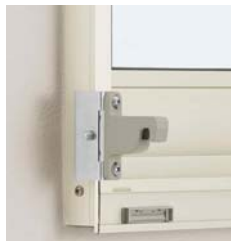
フック部取付金具