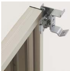
ボックス部取付金具