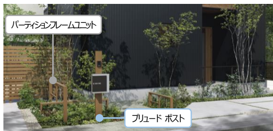
「プリュード ポスト」とのコーディネート例

また乾式門袖「ルシアス ウォールシリーズ」として、格子に同部材を使用した6デザインを追加。「パーティションフレームユニット」との組み合わせがおすすめです。