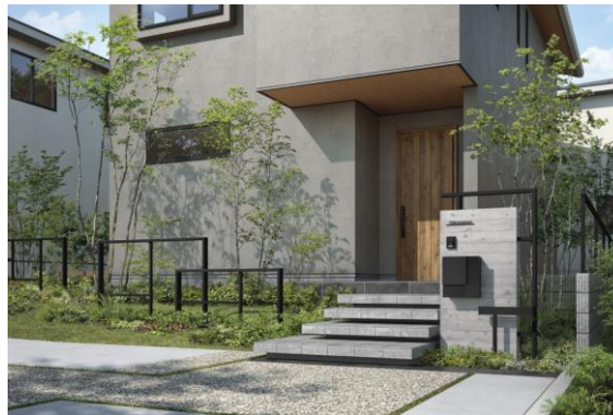
「プリュード」施工イメージ