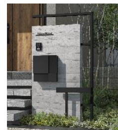
「ウォールフレームユニット」

オープン外構では、シンプルな建物をキャンバスとした、植栽が主役のプランニングがトレンドとなっています。このトレンドを受けて、シンプルな住宅外観や植栽を引き立てるアイテムに着目し、“ワンポイントのデザインを加える”という意味を込めた新シリーズ「プリュード」（PLUS+DESIGN=PLUDE）を発売します。