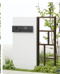
湿式門袖にプラス