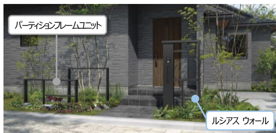
「ルシアス ウォール」とのコーディネート例