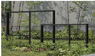
「パーティションフレームユニット」

YKK AP 株式会社（本社：東京都千代田区、社長：堀 秀充）は、ファサード空間にワンポイントのデザインを加える新シリーズ「プリュード」を2021年6月1日から発売します。植栽とともに住宅外観を引き立てる「プリュードウォールフレームユニット」と「プリュードパーティションフレームユニット」をラインアップします。