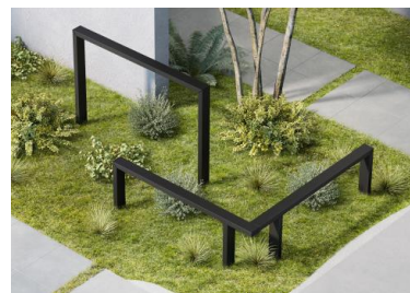
B型同士を連結することで、 コーナー納まりにも対応