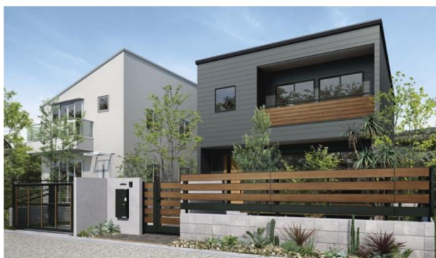
「ルシラス フェンス」X02型 施工イメージ

YKK AP 株式会社（本社：東京都千代田区、社長：堀 秀充）は、窓や玄関ドアとともに統一感のある住宅外観を演出可能な「ルシラス フェンス」シリーズを、2021年6月1日からリニューアル発売します。新しい意匠提案が可能なデザイン・カラーのバリエーション拡充を行い、施工性と耐風性能の向上を図り、商品提案力を強化します。