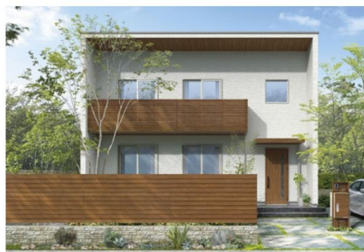
「ルシラス フェンス」H10型 施工イメージ

「ルシラス フェンス」は、建物と外構の美しい調和を目指した木調フェンスのスタンダードシリーズです。昨今、多くの方が自宅で過ごす時間が増える中、庭の役割があらためて見直されています。子供の遊びやガーデニングの場、ワークスペースでの活用など庭に求められる用途の広がりに伴い、庭時間に安心と快適性を確保する、高さ目隠し機能を備えたフェンス商品が一層注目されています。また、地震によるブロック塀の倒壊事例を受けたブロック塀からフェンスへの置換や、台風の強風対策など、近年多発する自然災害への配慮といった安全・安心のニーズも拡大しています。このような背景を受けて、YKK AP では、提案力・商品性能を強化した「ルシラス フェンス」をリニューアル発売します。