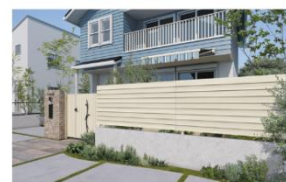
ルシアス フェンスH10型