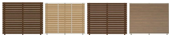
ルシアス フェンスH02型、H06R型、H07型、F05型 (全てT160)