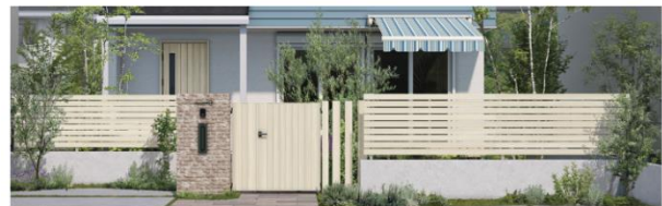
ルシアス フェンス H07型