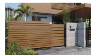
ルシアス スクリーンフェンス S06型