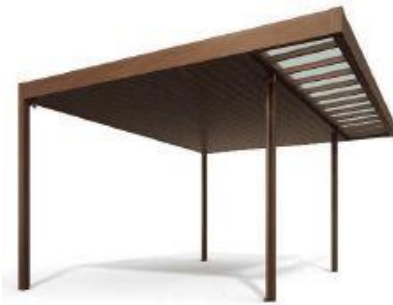
パネル屋根 軒天部分張り