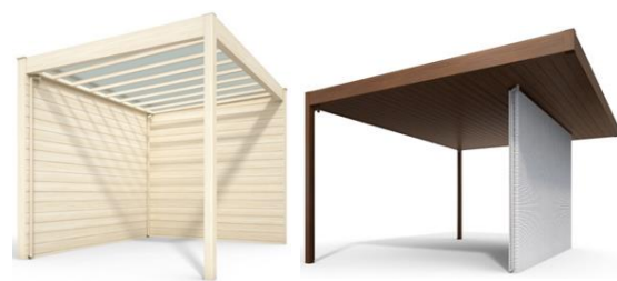
納まりバリエーション例