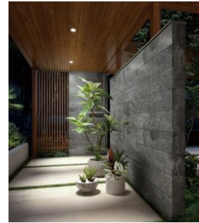
パネル屋根 軒天全面張り ダウンライト付き

また、アウトドアリビングに差し込む日差しを程よく調節し、過ごしやすい空間をつくり出す「サンシェードカーテン」の取付も可能。「サンシェードカーテン」は、雨風をしのげるパネル屋根下用と開放的なパーゴラ用の2種類を設定しています。