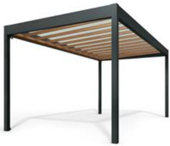
パネル屋根(軒天なし)