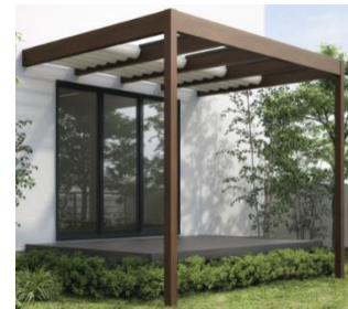
パーゴラ用 サンシェードカーテン