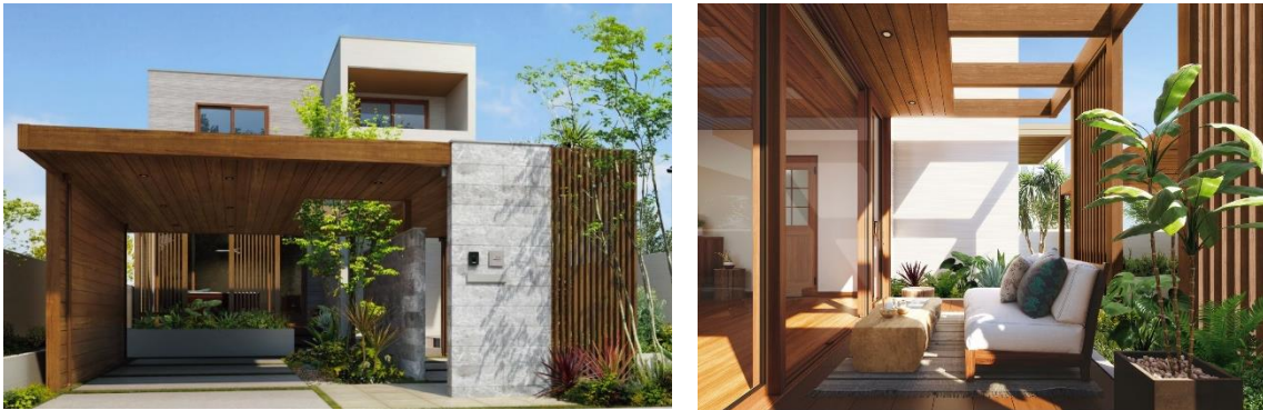
「リレーリア ルーフフレーム」施工イメージ (左)アプローチ屋根・カールーフ (右)アウトドアリビング

YKK AP株式会社（本社：東京都千代田区、社長：堀 秀充）は、玄関から車庫、庭まわりまで、暮らし方に合わせた自由設計で建物と調和した豊かな屋根空間を創出するエクステリア商品「リレーリア ルーフフレーム」を1月22日から発売します。