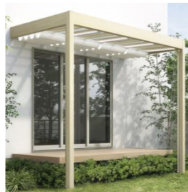
パネル屋根下用 サンシェードカーテン

また、アウトドアリビングに差し込む日差しを程よく調節し、過ごしやすい空間をつくり出す「サンシェードカーテン」の取付も可能。「サンシェードカーテン」は、雨風をしのげるパネル屋根下用と開放的なパーゴラ用の2種類を設定しています。