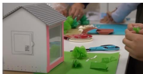
<模型を使った実験の様子>

YKK APでは、「エコスタディールーム Online」にて、全国の学校・教育機関や親子で学べる環境学習コンテンツとして、「窓とエネルギー」、「窓と換気」を紹介するほか、ライブセミナーでは、「窓から考えるエコハウスづくり」を配信します。このセミナーは、模型を使った実験を通して、“夏涼しい家”“冬暖かい家”のポイントや、自然を活かして快適でエコに過ごすための工夫に気付くことができる、弊社のオリジナルプログラムです。