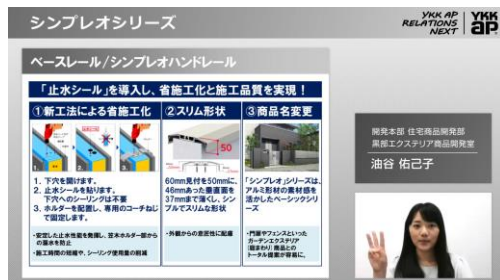
(左) 新商品ダイジェストムービー (右) 商品特長プレゼンテーションムービー