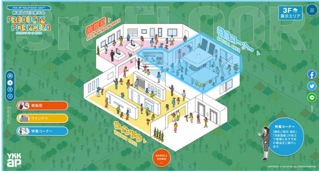
3階 展示エリアの様子

3階建ての仮想展示会場では、新商品を中心とした31アイテムを11の展示エリアで紹介。エリアをクリックすると動画が視聴できます。