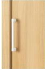
クローゼット折戸:把手