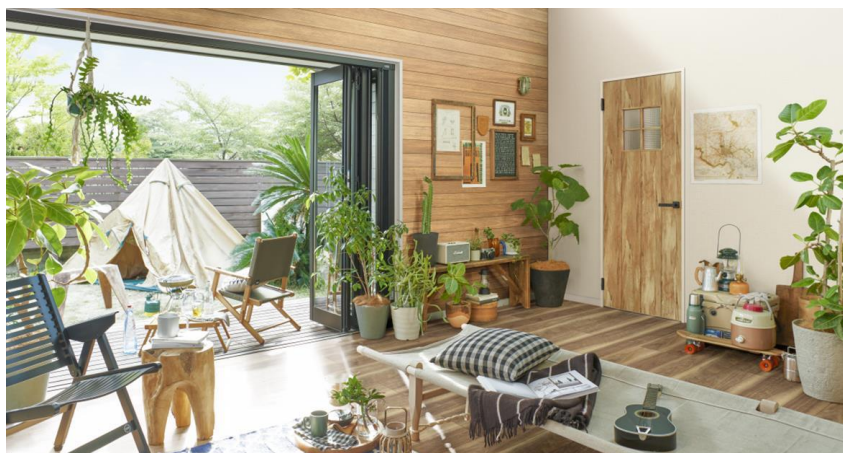
<「ラフォレスタ F」室内ドア施工イメージ>

YKK AP株式会社（本社：東京都千代田区、社長：堀 秀充）は、室内ドア・引戸などの建材に代表される木質インテリア建材「ラフォレスタ F」「ラフォレスタ」を4月6日からリニューアル発売します。トレンドのアウトドアミックスのテイストを取り入れたカラーとデザインを投入し、リビングテラス空間を中心に、内と外がつながる開放的で自然を感じられるインテリア空間を演出します。