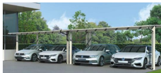
横並列「エフルージュ ツイン FIRST」施工イメージ

床面積 50 m 2 以下のカーポートを各々独立して設置し、隣合う屋根部をカバーで覆う構造です。今まで対応できなかった車4台以上の並列駐車提案が可能になりました。