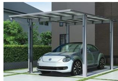
「エフルージュ ワン FIRST」施工イメージ

フラットな意匠はそのままに、安心感がある両側支持タイプの1台駐車用の幅 30 (3013 mm) の「エフルージュ ワン F I R S T」を新規設定。また、「エフルージュ ツイン F I R S T」にコンパクトサイズの幅 36 (3608 mm) を設定し、様々な敷地に柔軟に対応します。