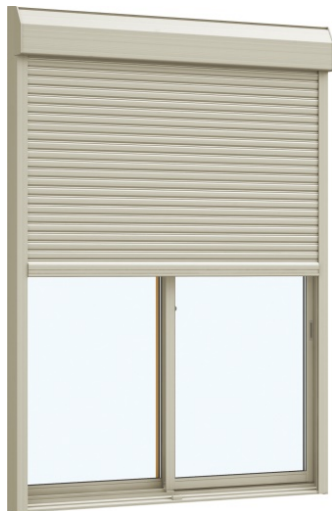
「エピソードNEO」シャッター付引違い窓