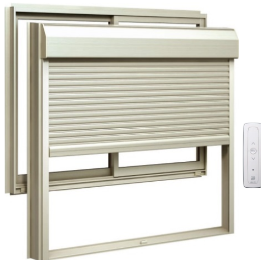
「かんたんマドリモ シャッター」