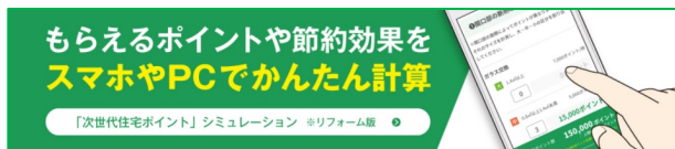
「次世代住宅ポイント」シミュレーション リフォーム版

「次世代住宅ポイント制度」対象の TDY 商品を、リフォーム内容や付与ポイントと共に紹介した「次世代住宅ポイント制度活用ガイド リフォーム編」を配布します。また、もらえるポイントや節約効果をスマートフォンや PC でかんたんに計算できるコンテンツ「ポイントシミュレーション リフォーム版」も紹介し、「次世代住宅ポイント制度」の活用方法を提案します。