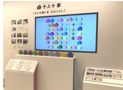
TDY 新宿コラボレーション SR「十人十家」ギャラリー

あこがれの 10 の暮らし方プランのリモデルポイントや、採用商品概要などの情報を掲載した「“十人十家”コレクションブック」を配布するほか、コンセプトをまとめたムービーの放映も行います。360° パノラマ動画も用意し、スマートフォンと VR ヘッドセットを用いることで VR での視聴も可能。空間の中に入り込んだような臨場感を体験いただけます。