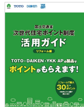
「次世代住宅ポイント活用ガイド リフォーム編」表紙

https://re-model.jp/about/jisedajutakupoint/simulation/