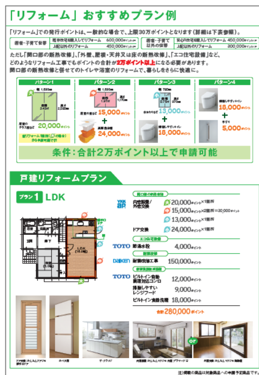
「次世代住宅ポイント制度活用ガイド」の解説ページ例

TDYでは、税制や補助・融資といった支援制度の認知を広げ、その制度をご活用いただくことで、お客様の理想の住まいづくりに貢献できると考えています。引き続き、対象商品の提案を含め、情報発信をすすめていきます。