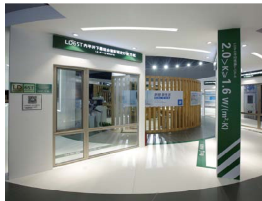
左：2018/10/31～11/3に中国・北京で開催された「Fenestration Bau China 2018」会場で行われた「金軒賞」表彰式の様子。右から4番目がYKK中国投資社 AP事業部長 松本昭弘。 右：「Fenestration Bau China 2018」YKK APブース内の「LD65T」展示コーナー