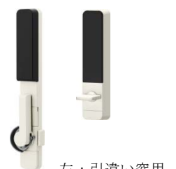
左：引違い窓用 右：勝手口ドア用

引違い窓用クレセントセンサーと勝手口ドア用サムターンセンサーは、使用者がカギを操作（施解錠）する力（作用）により微弱な電気を発電し、電波を送って通信を行う技術を活用。電池交換なども不要です。