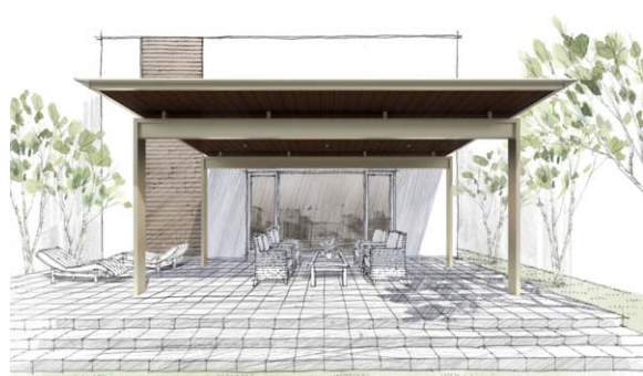
Situation 2 リビングからつながる快適な屋外空間を提案