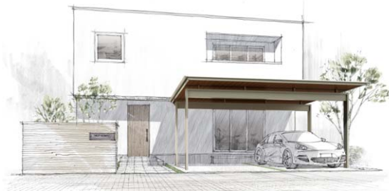
積雪 30 cm/ダウンライト付き/木調色軒天 幅 6300 mm×奥行 5100 mm×高さ 2825 mm