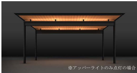
アップライト ※アップライトのみ点灯の場合 束構造を活かした演出光が、屋根を浮かび上がらせる