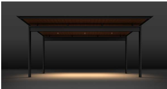
ダウンライト 軒天から屋根下空間を照らす

天井や梁に設置するダウンライト、美しい木調の天井を強調するアップライト。構造を生かした照明が、空間をドラマチックに演出し、利用者や街ゆく人々の日常に彩りを加えます。