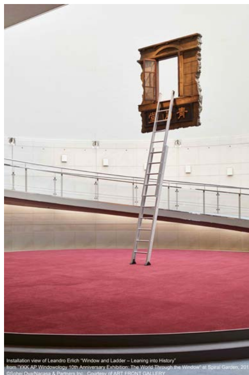
Installation view of Leandro Erlich "Window and Ladder - Learning into History" from "YKK AP Windowology 10th Anniversary Exhibition The World Through the Window" at Spiral Garden, 2017

国内外の建築家、研究者、写真家、デザイナー、アーティストなど、多彩な専門家が“窓”を主題に研究発表や新作アート作品を展示します。大人から子どもまで“窓”について楽しみ、学ぶことができる展覧会です。ぜひご来場ください。