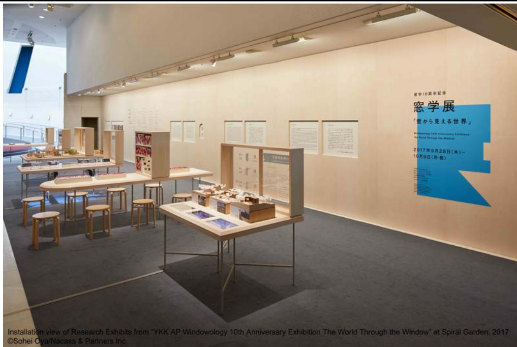
Installation view of Research Exhibits from "YKK AP Windowology 10th Anniversary Exhibition The World Through the Window" at Spiral Garden, 2017

アートからアカデミックな研究まで、古今東西の窓の知見と魅力が集結 10月9日まで東京都港区 スパイラルガーデンにて開催中