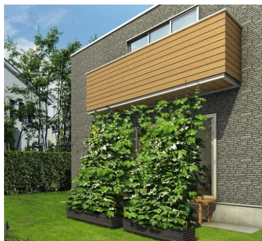
フックを活用してグリーンカーテン設置