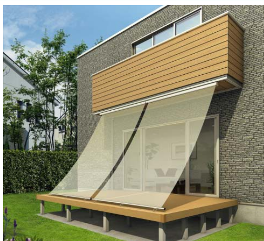
日よけ「アウターシェード」を設置