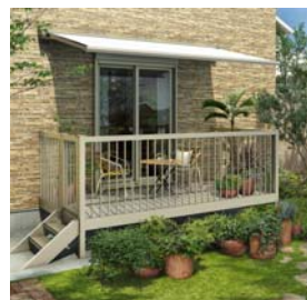
柱建式 庭置納まり