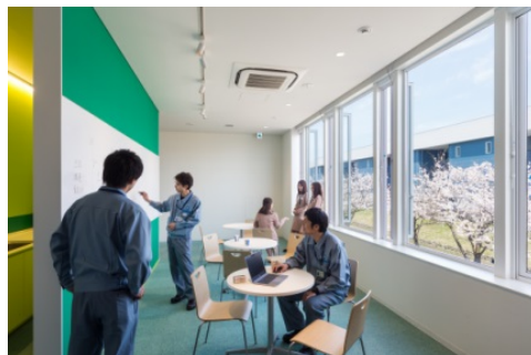
リフレッシュコーナー