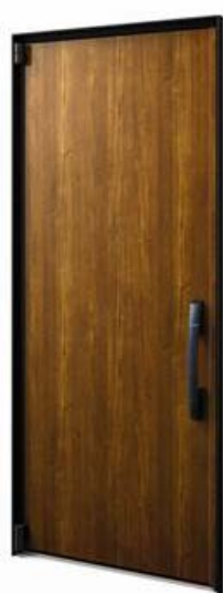
「InnoBest D50」 アルミ樹脂複合枠仕様 （110デザイン）