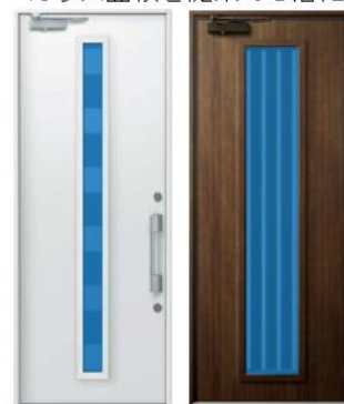
「デュガード」04デザイン 「D50防火ドア」104デザイン