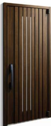
「InnoBest D50 防火ドア」 （104デザイン）

これらのバリエーション充実により、APW樹脂窓シリーズとあわせて住宅のすべての開口部で高断熱化の提案を、更に推進します。