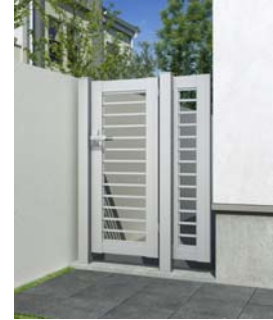
「シンプレオ」片開き専用門扉 K1 型 (オプション:袖 FIX 付)

勝手口やサービスヤードの入口など限られたスペースにもピッタリと納まる“片開き専用門扉”を設定。