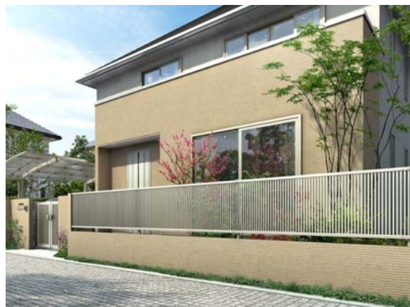
「シンプレオ」門扉 2 型とフェンス 2 型 (プラチナステン色)