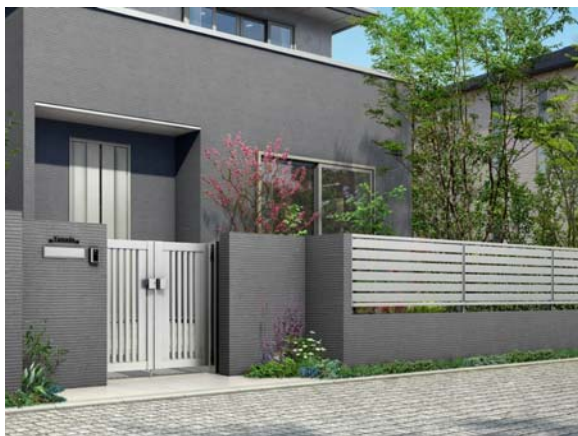
「シンプレオ」門扉 S1 型とフェンス SY1 型 (ピュアシルバー色)

YKK APでは、従来複雑だったエクステリア（外構）商品の体系を整備し、この「シンプレオ」シリーズの投入により新体系が整いました。アルミ型材系では、最高級シリーズの「エクスティアラ」、スタンダードシリーズの「ルシアス」、そして「シンプレオ」の3シリーズ。アルミ鋳物では、味わい深い質感を表現した「シャローネ」シリーズを揃えることで、商品を使いやすく選びやすくし、より一層の提案力強化に繋げてまいります。