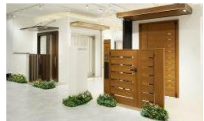
YKK AP : 玄関コーナー