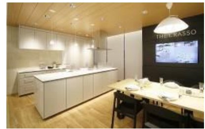
TOTO : システムキッチンコーナー