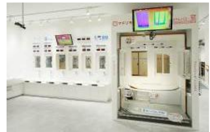
TYコラボ : 浴室+窓リフォームコーナー