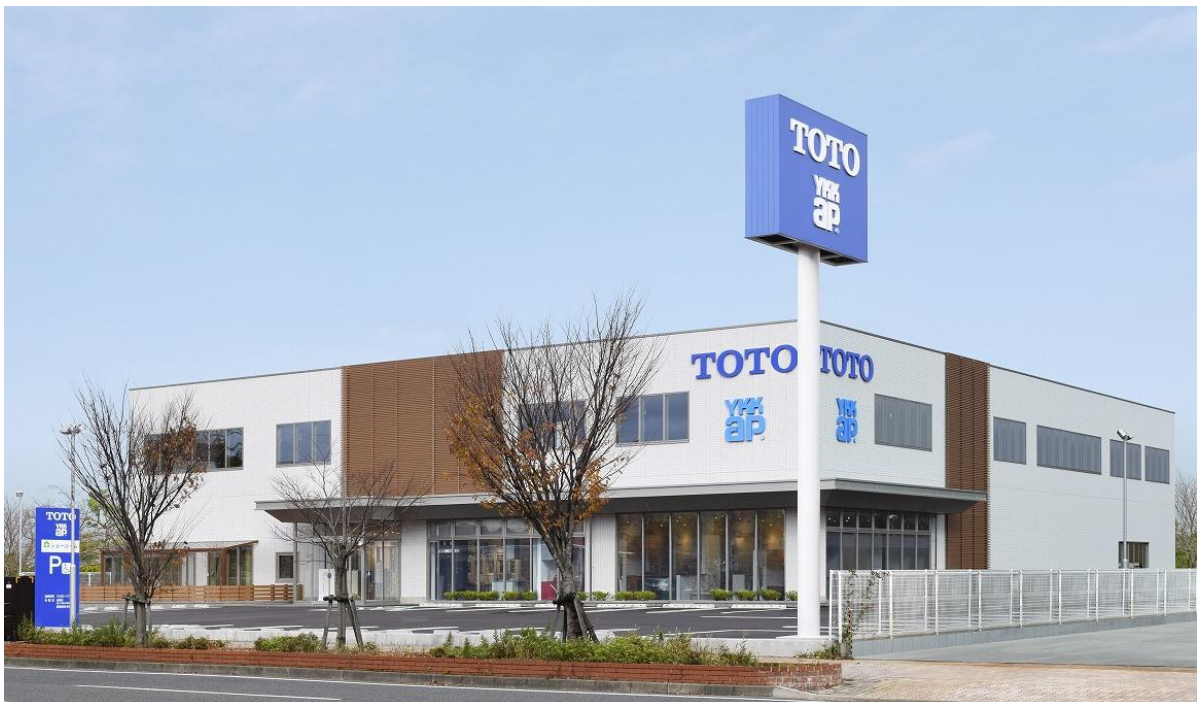
ショールーム外観

また、コラボレーションショールームでリモデルクラブ店(※2)と連携したイベントを開催するなど、住まいづくりや商品を提案・提供する場として活用し、地域に貢献してまいります。