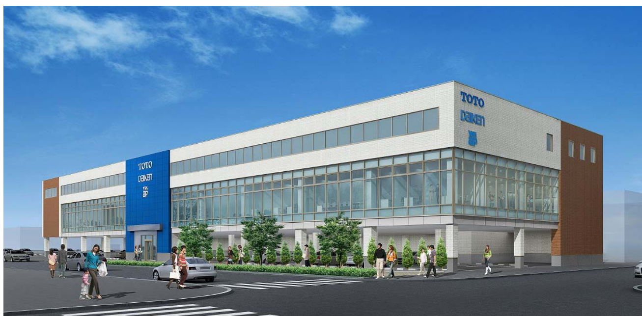
「TDY札幌コラボレーションショールーム」外観イメージ

TDY3社による、ショールームの規模拡大、機能強化と共に周辺施設と一体となり、これまで以上に広域からのお客様に向けて魅力的な情報を発信していきます。