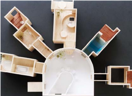
TOTO・YKK APエキシビジョンハウスの断面 部屋の開いた窓から次の空間へ入れます