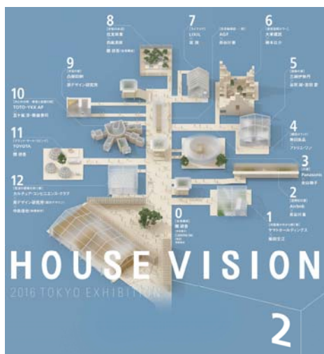
【HOUSE VISION 2016】

※TOTO・YKKAPが2013年に出品した「極上の間」は、「日常を忘れた時間を過ごせるひとりのための空間」をコンセプトに室内の壁面を360度緑で覆い、そこに窓とトイレと洗面器を配置し、透明で広がりのある清浄な空間としました。