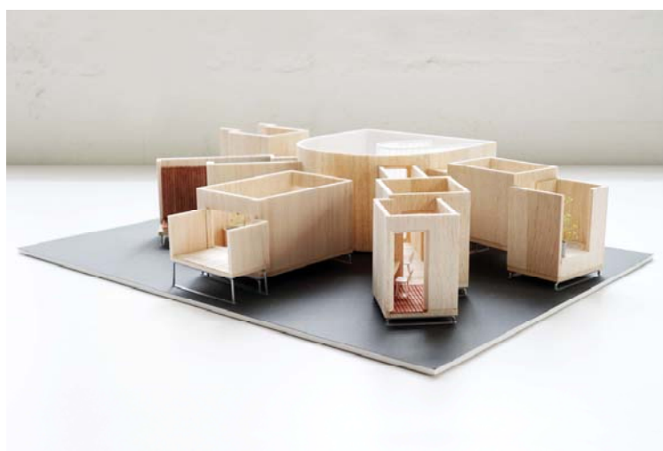
【TOTO・YKK AP エキシビジョンハウスのイメージ】

『HOUSE VISION』 公式サイト http://house-vision.jp/